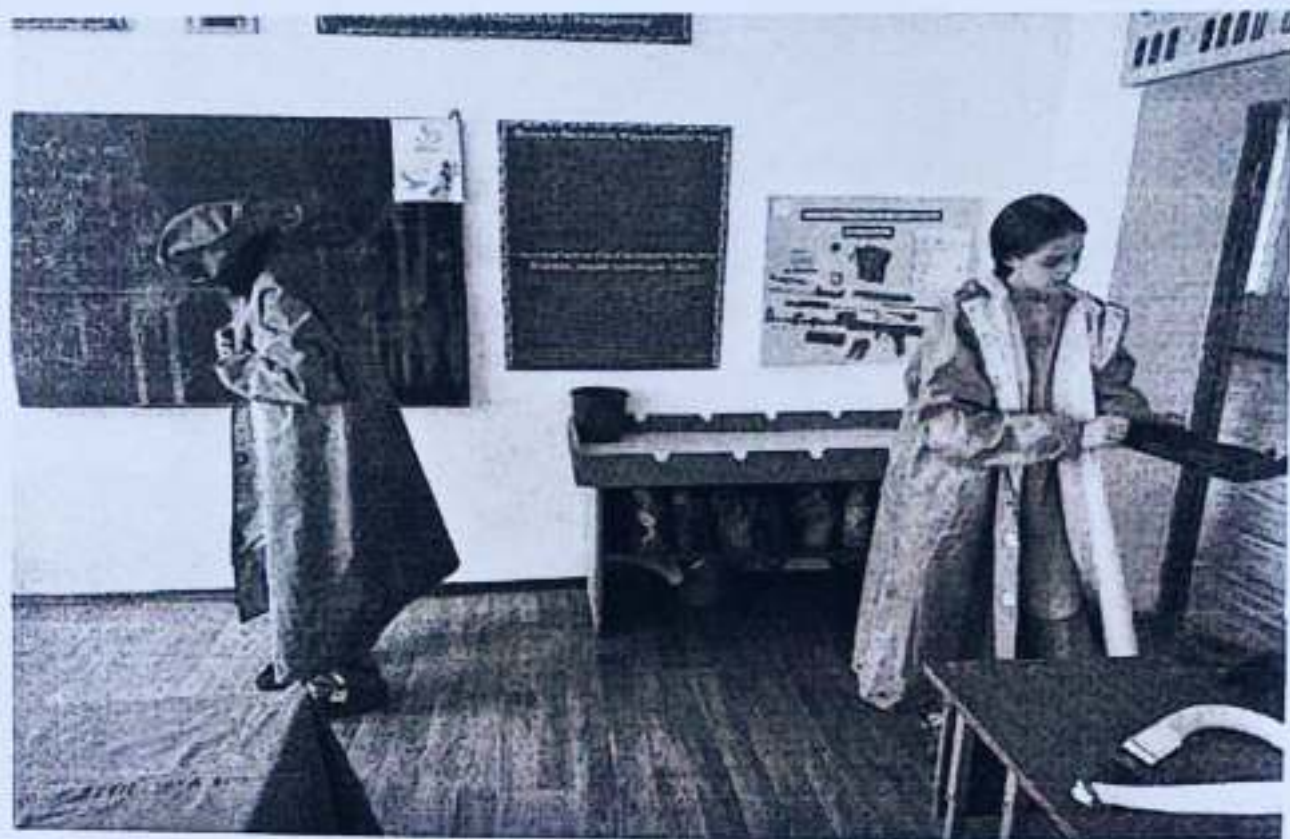
Военно-патриотический клуб Жас Сарбаз изучение и одевание средств СИЗ (средства индивидуальной защиты)