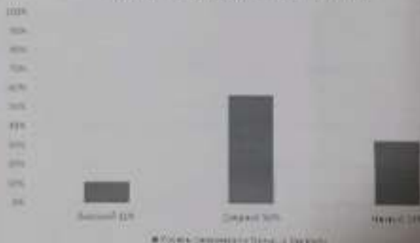
Уровень тревожности 5 класса Филиппа

По результатам диагностики стало очевидно, что 33% пятиклассников испытывают низкий уровень тревожности, что говорит о том, что адаптация в средней школе не является стрессовой для учащихся.